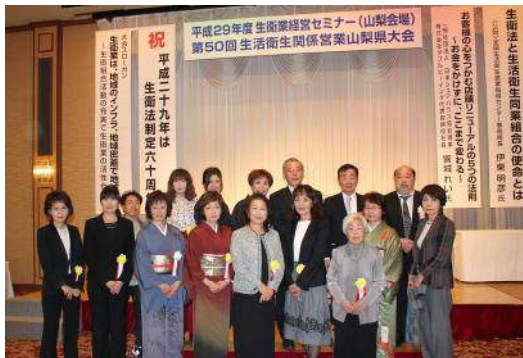
表 彰 披 露